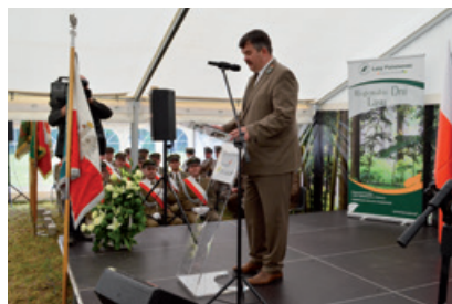
Wystąpienie dyrektora RDLP w Radomiu