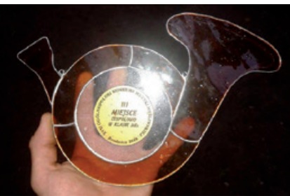
ZDJĘCIE ROMAN NOWORZYCKI