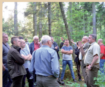
Studenci w Nadleśnictwie Skarżysko

Studenci leśnictwa z Falii Uniwersytetu Łódzkiego w Tomaszowie Mazowieckim gościli w ramach ćwiczeń kompleksowych na terenie RDLP w Radomiu.