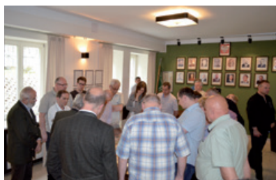
Poznaniacy w siedzibie radomskiej dyrekcji