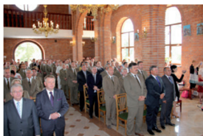
Uczestnicy mszy św.