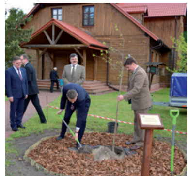
Aby uczcić jubileuszową XV edycję Święta Polskiej Niezapominajki w Jedlni-Letnisku, posadzono pamiątkowy dąb