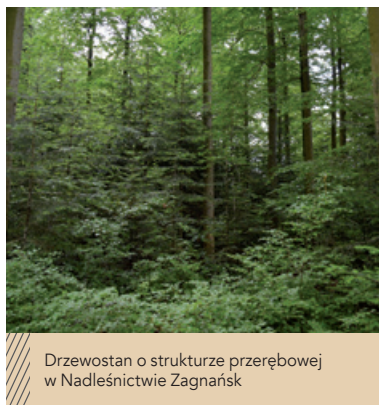
Drzewostan o strukturze przerębowej w Nadleśnictwie Zagnańsk