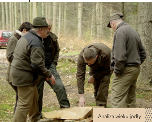
Analiza wieku jodły

W kwietniu na terenie RDLP w Radomiu odbyło się spotkanie mające na celu omówienie spraw związanych z możliwością zastosowania jednostek kontrolnych w planowaniu urządzeniowym i bieżącej działalności gospodarczej nadleśnictw.